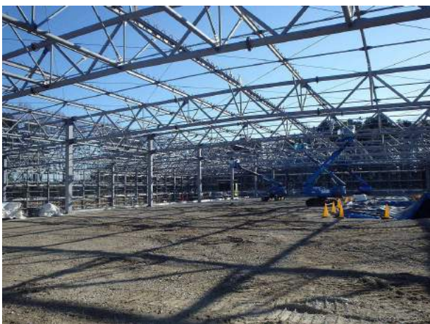
(仮称) 名鉄運輸株式会社 野田支店 新築工事