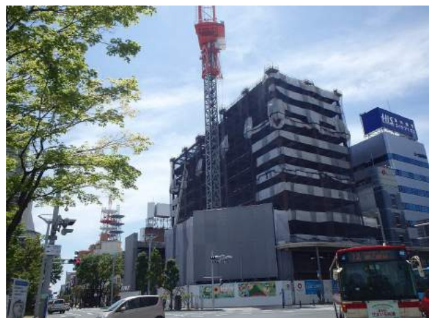
ダイワロイネットホテル郡山 新築工事