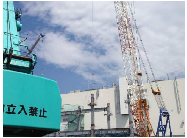
日本ハムファクトリー(株)新B棟建築工事