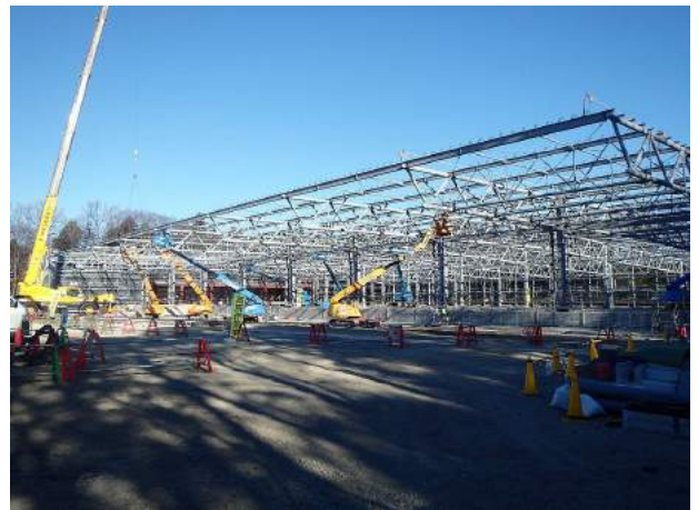
(仮称)名鉄運輸株式会社野田支店新築工事