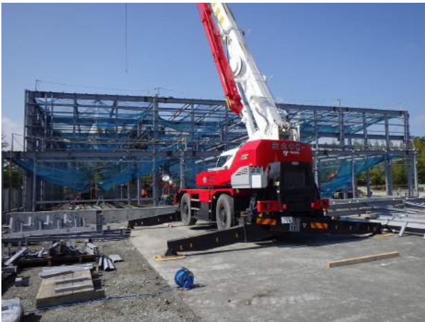
(有)ワインディング福島原町工場新築工事