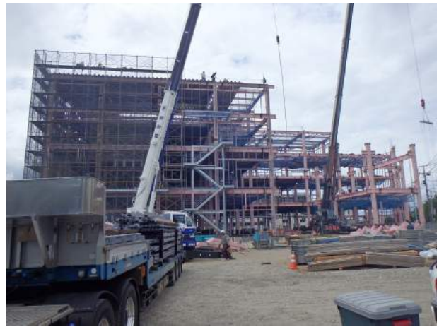
(株)同仁社伊達工場新築工事