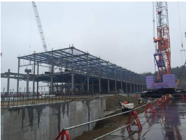
(仮称) Dプロジェクト仙台泉Ⅱ 新築工事