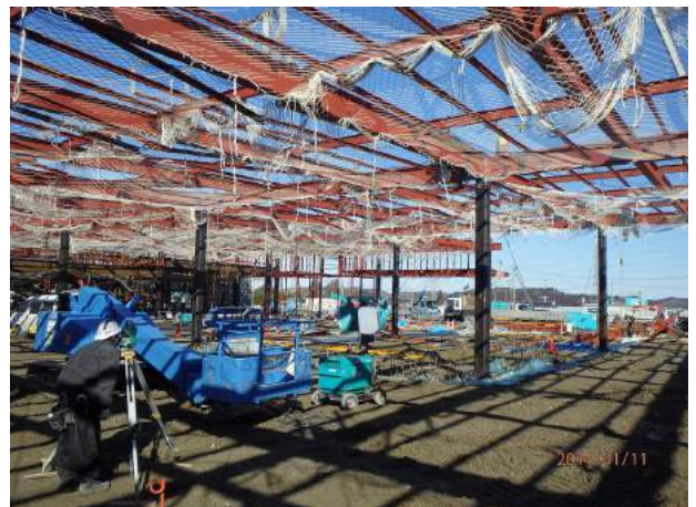
仙台 松森複合商業施設新築工事