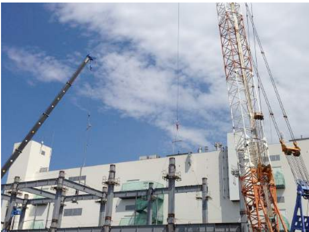
日本ハムファクトリー(株)新B棟建築工事