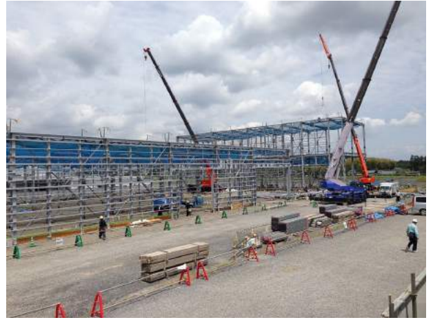
(仮称) シーズイシハラ株式会社茨城工場建設工事