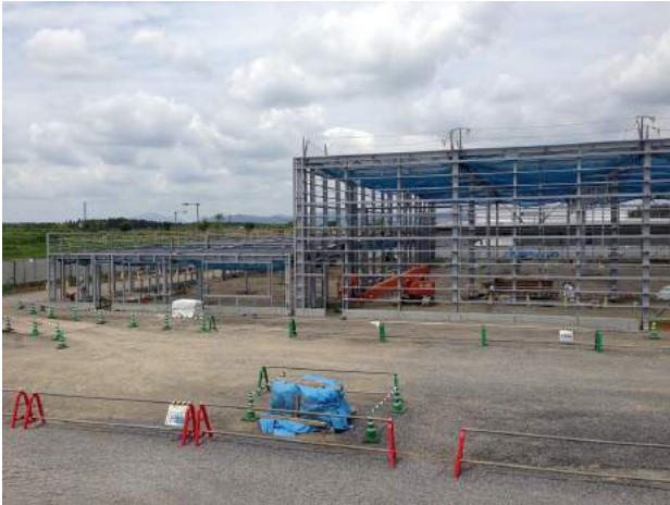
(仮称) シーズイシハラ株式会社茨城工場建設工事